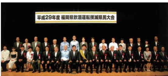
所管の委員長として飲酒運転撲滅のための大会に出席。