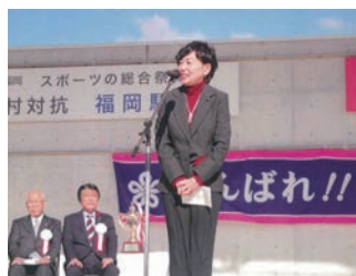
県民体育大会でご挨拶させていただきました。