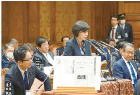
2023 年は予算委員会などで計 14 回質問に立ちました

ぜひ皆様の後押し、ご支援をよろしくお願いいたします。 2024 年初春 堤かなめ