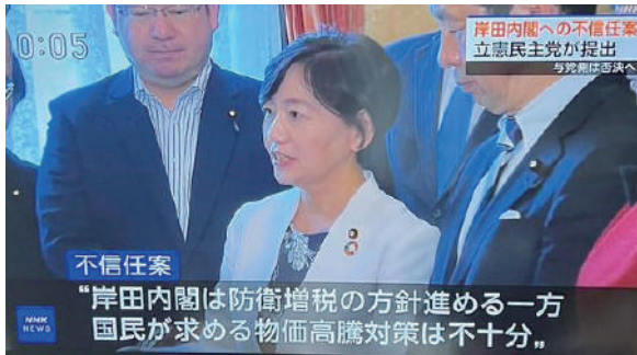
通常国会会期末には、岸田内閣への不信任案を提出 (NHK ニュースより引用)